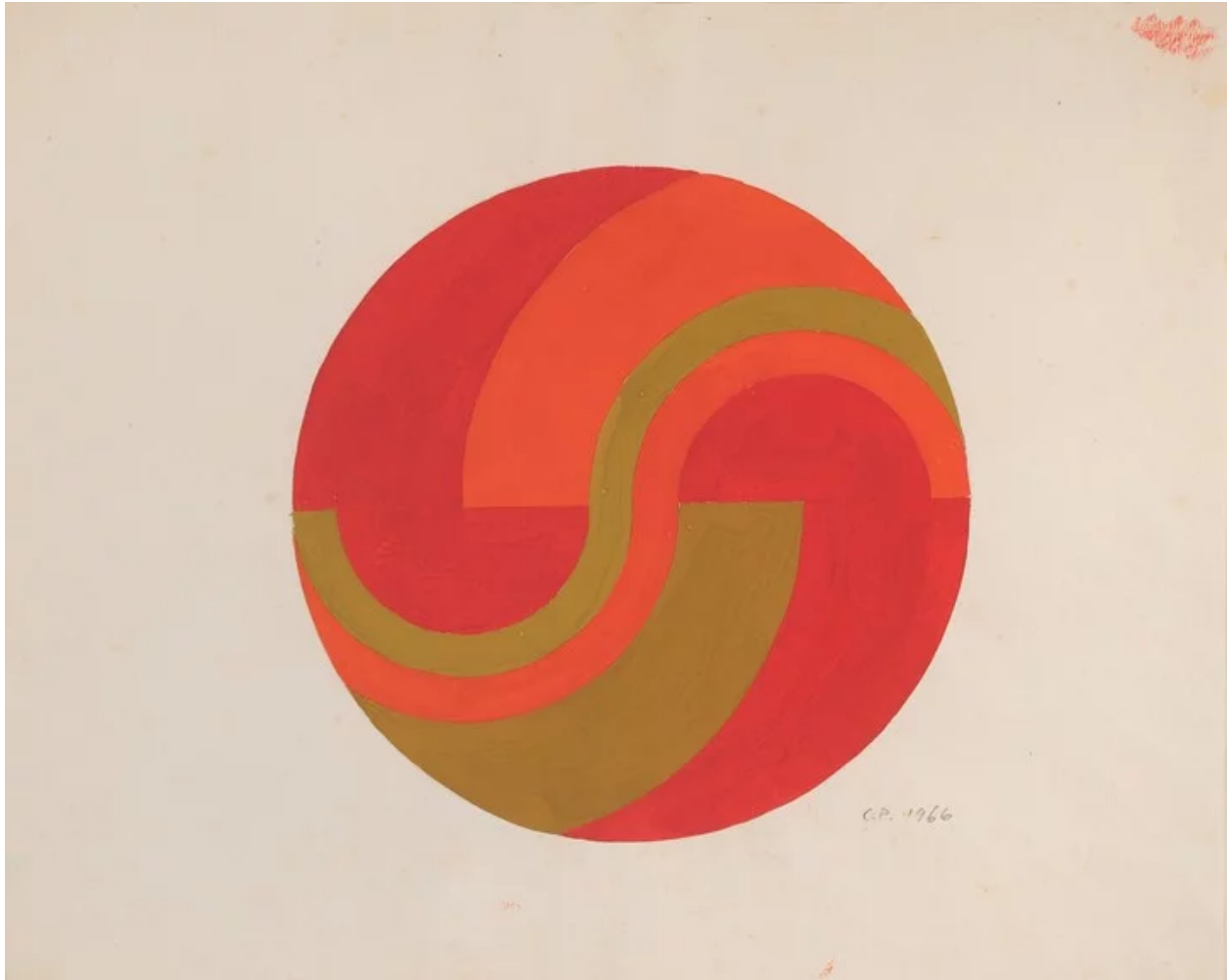
César Paternosto. Figuras y colores