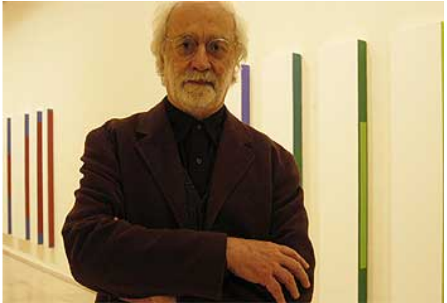
César Paternosto, ante una de sus obras expuesta en Segovia. A. M.

César Paternosto (La Plata, Argentina, 1931) se instaló en Nueva York en 1967. En su obra, fuertemente vinculada a la abstracción geométrica, hay una profunda evocación del silencio, y pretende invitar al espectador a detenerse y a hacer una especie de vacío, en el sentido positivo "de posibilitar el recogimiento en este momento de nuestra civilización, donde estamos aturdidos visualmente por la televisión o por la publicidad gráfica", explica. A partir de hoy, el Museo de Arte Contemporáneo Esteban Vicente, de Segovia, acoge una muestra de su obra de madurez.