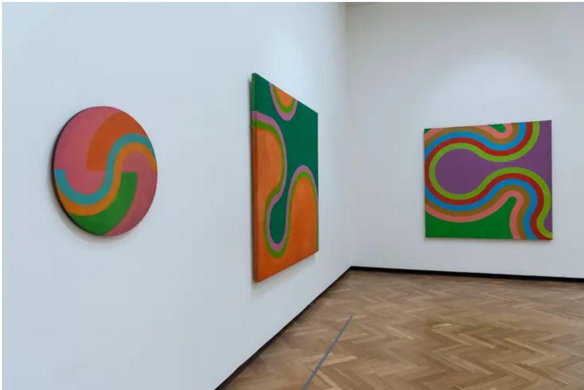
Vista de sala de la muestra César Paternosto. La mirada excéntrica en el MNBA